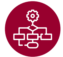
Modelo de Negocio